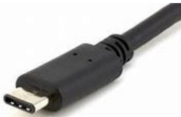
USB Type-C 形状