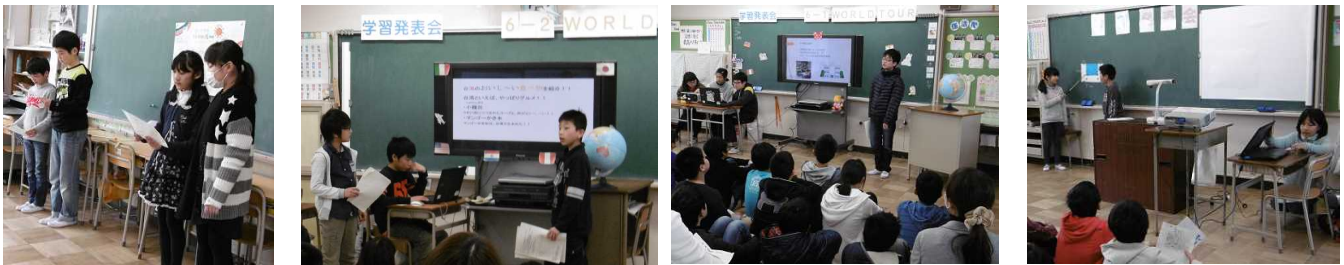
2月12日(火) 学習発表会(4年1組)