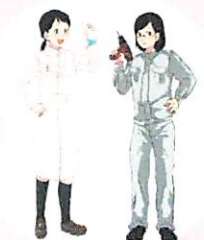
生活コースの新設により女子も学びやすい学習環境に!