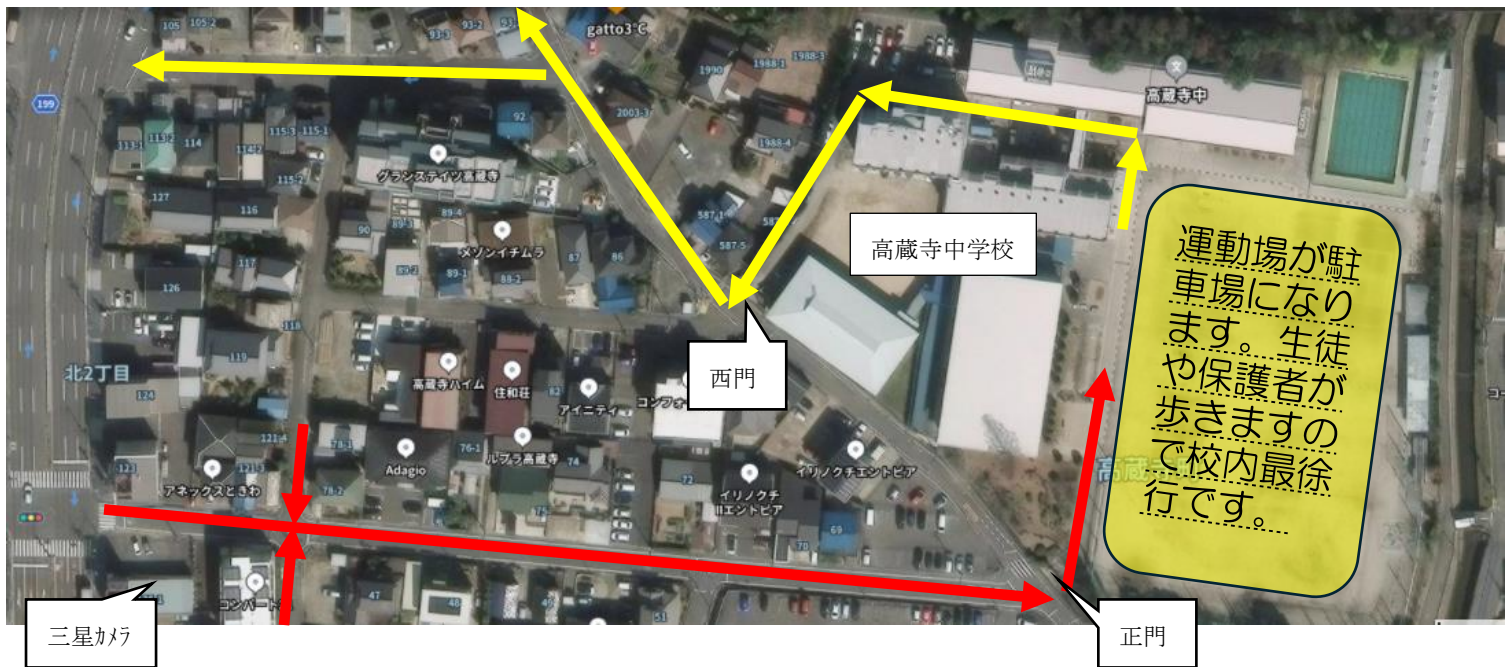
【図1】お車のルート 正門が入口・西門が出口 赤線：来るルート 黄線：帰るルート