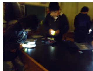
かい中電灯で照らすと...