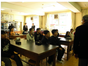
電気はどこから来るの?