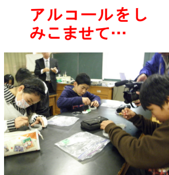
アルコールをしみこませて...