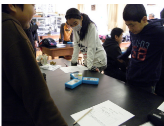
「はかるくん」で放射線量を測っています。