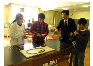
電気を作って電車を走らす。